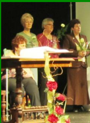
K oceneniu BLAHOŽELÁME